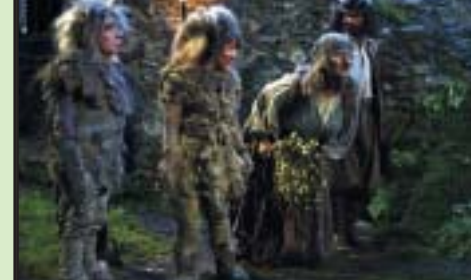
Österreich/Kanada 2003, Regie: Bernd Neuburger mit: K. Merkatz, K. Breitebner, Sarah-Jeanne Labrosse 90 Min., empfohlen ab 8