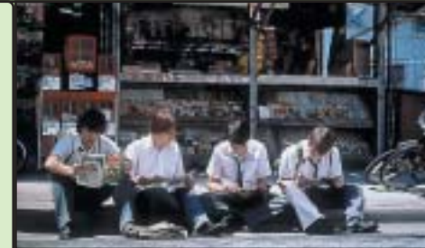
USA 2002, Regie: Peter Care mit: Jodie Foster, E. Hirsch, Kieran Culkin, V. D'Onofrio 100 Min., empfohlen ab 12