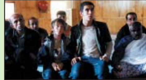
Dänemark 2002, Regie: Pia Bovin mit: Frederik C. Johansen, Lars Brygmann, B. Neumann 85 Min., empfohlen ab 8 Originalfilm – Deutsch eingesprochen